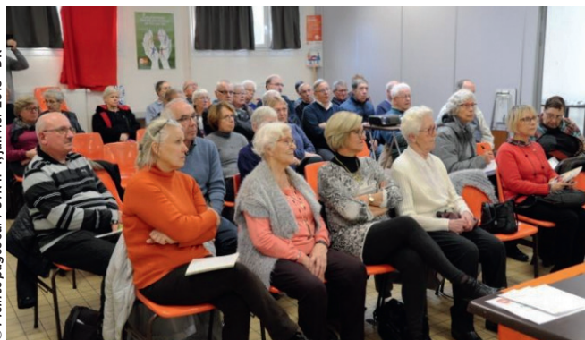
Les unions locales ou territoriales de retraités organisent régulièrement des réunions-débats sur, entre autres, la politique de santé (ici à Armentières).