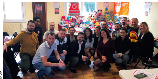
Dernière initiative du groupe jeunes de la CFDT-Paca : une collecte de jouets, en partenariat avec la Croix-Rouge française, était organisée en novembre.

Ces jeunes militants, issus de tous les syndicats de la région, ont planché près d'une année pour monter cette initiative qui répondait à plusieurs objectifs. Mieux comprendre de quoi on parle quand on évoque l'intelligence artificielle, réfléchir aux implications concrètes dans