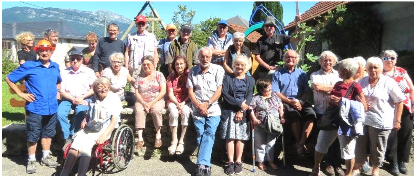
Les participants à la journée posant pour la photo souvenir

Le bulletin de mai présentait un programme de visites ambitieux. Il y a tant de choses à voir en Bauges. Mais les paysages et la bonne ambiance ont incités les 26 participants à ne pas se presser, bref, à prendre son temps.