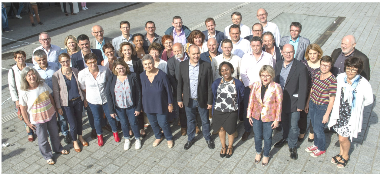
Le Bureau National Confédéral avec ses 40 membres