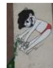
Le petit bonhomme récurrent de Super Bourdi »

Certains dessins sont humoristiques tels