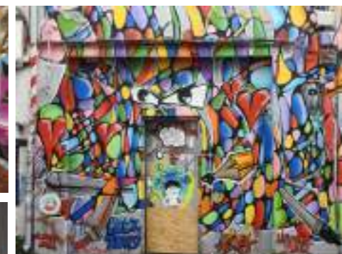
Une façade de la rue St Nicolas