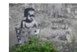
d'autres plus engagés.

Ces œuvres d'art ont une durée de vie très variable mais certaines, telle celle destinée à la mémoire d'un des leurs décédé, vont rester plus longtemps.