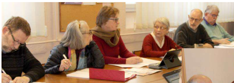
Conseil UTR 71 de janvier 2017 Au Creusot