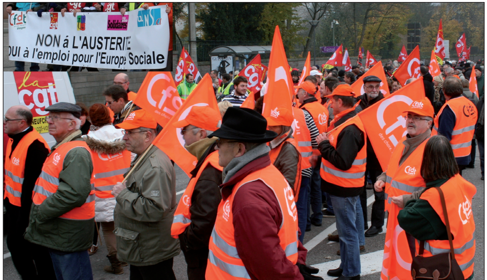
Les retraités CFTD à la manifestation du 14 novembre à Epinal.