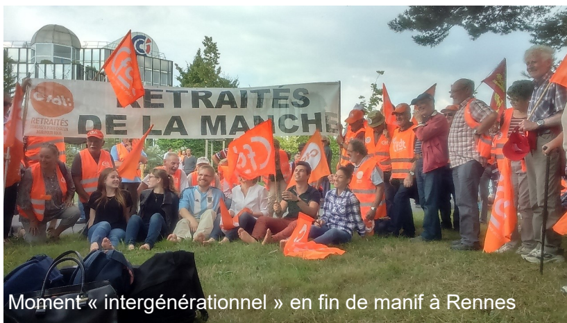
Moment « intergénérationnel » en fin de manif à Rennes