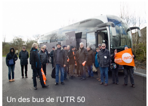
Un des bus de l'UTR 50

La revalorisation des pensions est une priorité dans le cahier revendicatif de la CFDT RETRAITES.