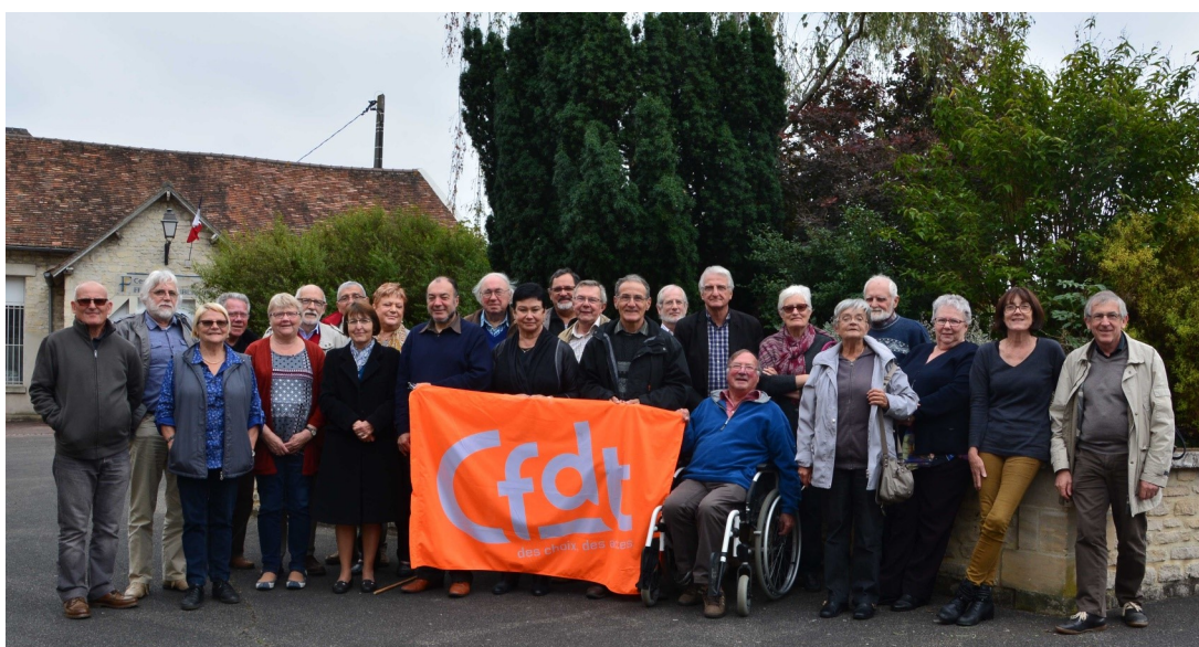
Les conseillers URR de Haute et de Basse Normandie à Mondeville